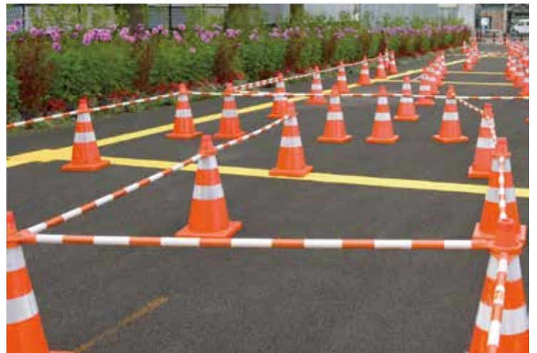
細い径のコーンバーにも貼付可能