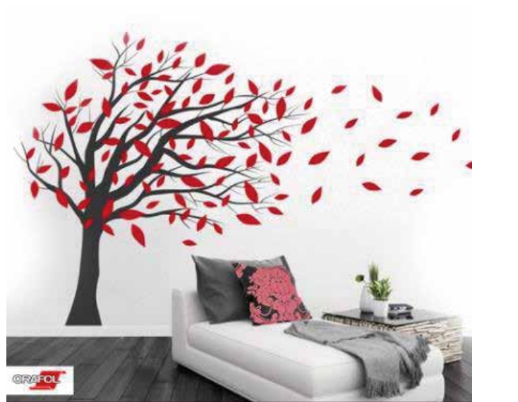
壁紙に貼っても綺麗に剥がせるので 四季に合わせてお部屋の模様替えができます