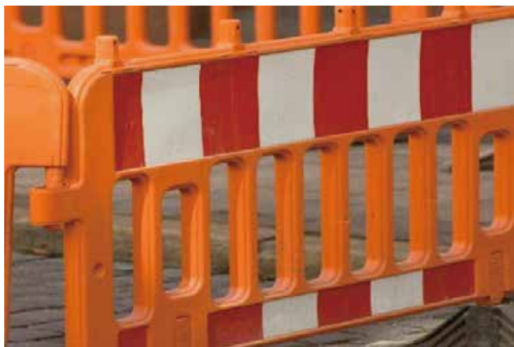
シルクスクリーン印刷可能、端部処理不要です