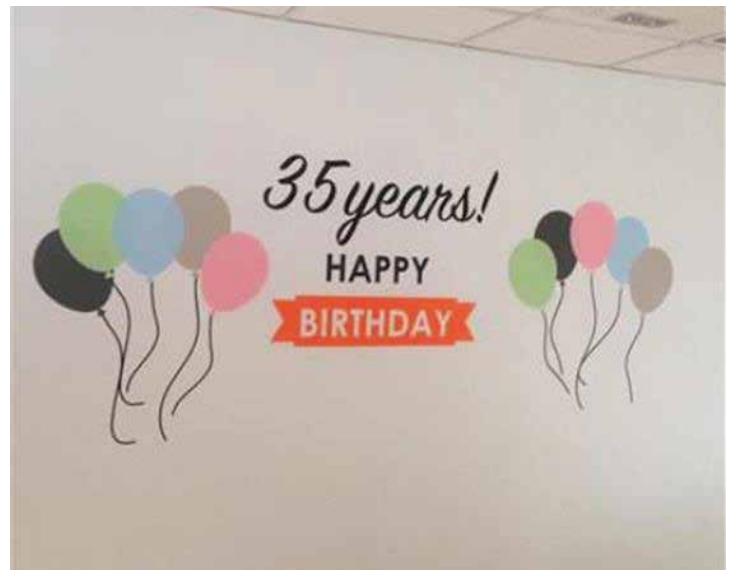
イベント告知やお祝いメッセージに