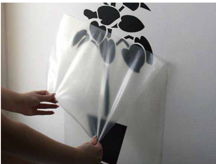
アプリケーションテープを使ってきれいに貼れます おすすめはORATAPE® LT95