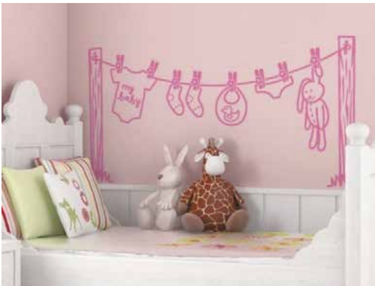
子供部屋をかわいくデコレーション