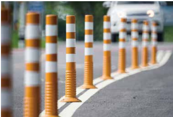
車線分離標に最適